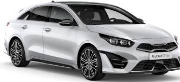
Deluxe White (HW2)