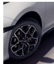
Felgi aluminiowe GT-Line z oponami w rozmiarze 225/45/R17