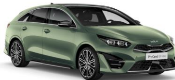
Experience Green (EXG)