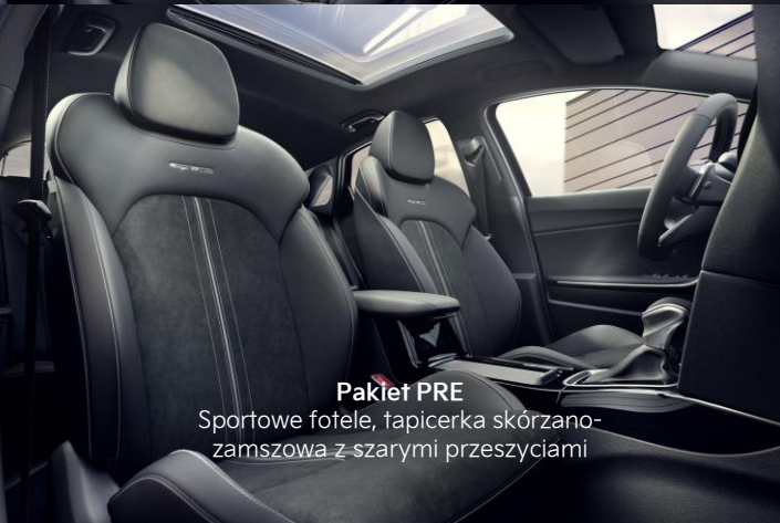
Pakiet PRE Sportowe fotele, tapicerka skórzano-zamszowa z szarymi przeszyciami

Tapicerka GT-Line materiałowa z elementami skóry ekologicznej