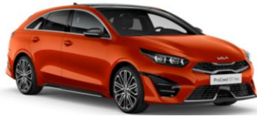
Orange Fusion (RNG) dostępny tylko dla samochodów ze stoku