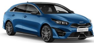
Blue Flame (B3L)