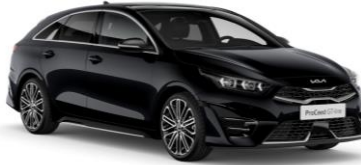
Black Pearl (1K)