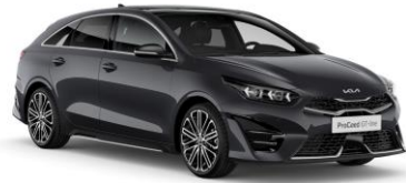
Penta Metal (H8G)