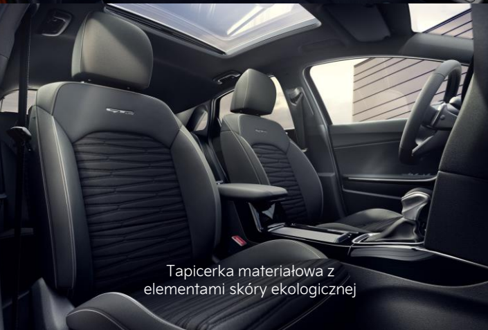
Tapicerka materiałowa z elementami skóry ekologicznej