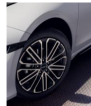
Felgi aluminiowe GT-Line z oponami w rozmiarze 225/40/R18