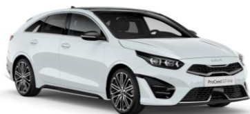
Cassa White (WD) bez dopłaty