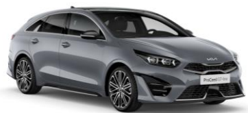
Lunar Silver (CSS)