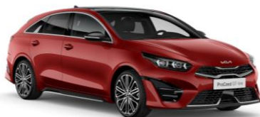
Infra Red (AA9)