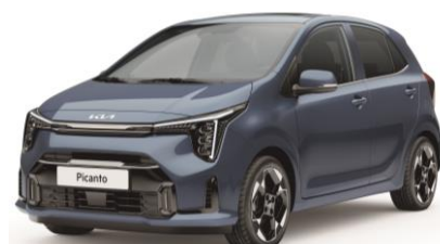
metalizowany Smoke Blue (EU3) antena dachowa czarna